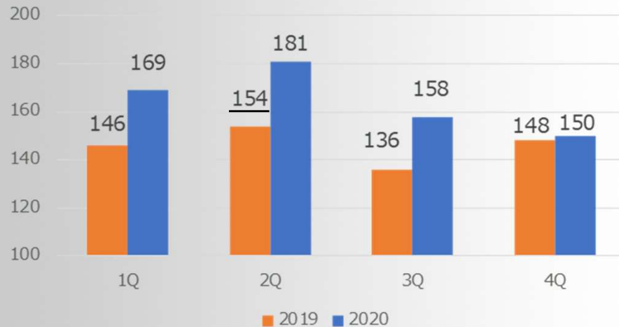
ロイヤリティ収入の推移

(ロイヤリティ収入) 2019年下期より、4K/8K高解像度ソリューションのロイヤリティ収入が立ち上がったことで、2020年は底上げができる。