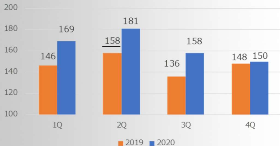
ロイヤリティ収入の推移

(ロイヤリティ収入) 2019年下期より、4K/8K高解像度ソリューションのロイヤリティ収入が立ち上がったことで、2020年は底上げができる。