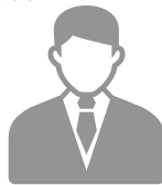
manorda モデル A

銀行員が商社を兼務する「銀商マン」となって、商社員の立場で地域内ビジネスの源泉に関与することで、銀行本体のビジネスモデル変革と行員の行動改革を促します。