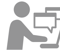
manorda モデル C

中長期的には、商社事業の拡大とデジタル技術の活用により、スピノフ事業を生み出すマザーカンパニーを指向します。