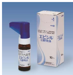
エピシル® 日本製品