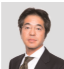
所有する当社の株式数 普通株式