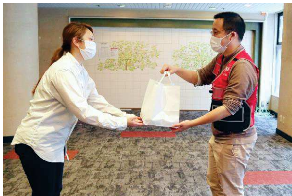
JMATチームへのお届けの様子

オーストラリア・シドニー発のオールデイダイニング「bills」は、新型コロナウイルス感染症拡大による世界的な混乱が続く中、最前線で戦い続ける医療従事者に敬意を表し、昨日25日(月)に日本医師会災害医療チーム（JMAT）へ、そして本日26日(火)に浜の町病院へ、billsのメニュー50食を無償提供いたしました。