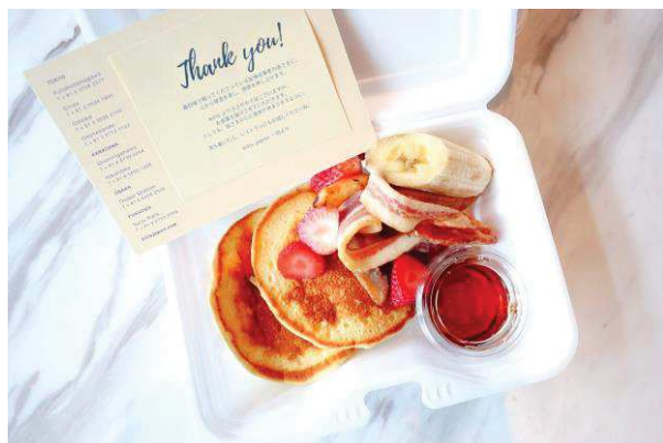
無償提供した「バターミルクパンケーキ w/ スモークベーコン、パイナップル、メープルシロップ」