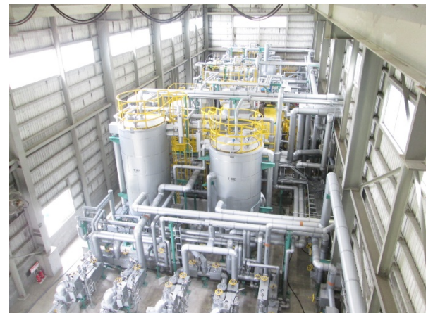
原油処理設備全景