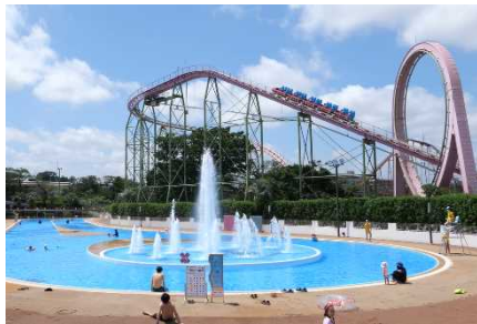
プール営業の様子