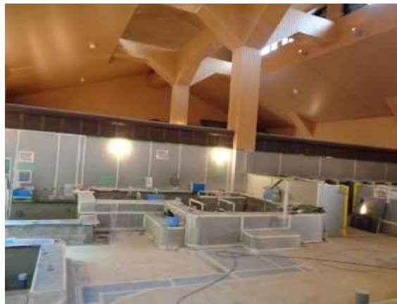
内風呂リニューアルの様子