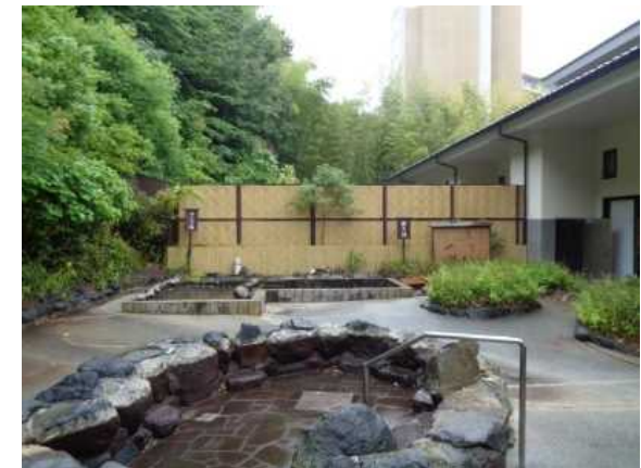
露天風呂リニューアルの様子