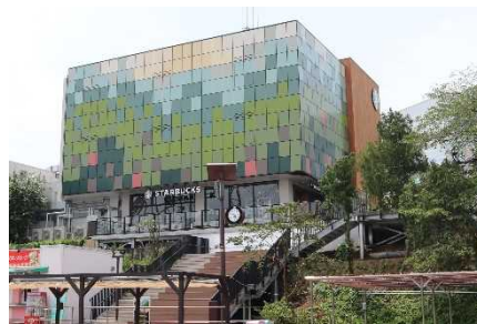
スターバックス外観