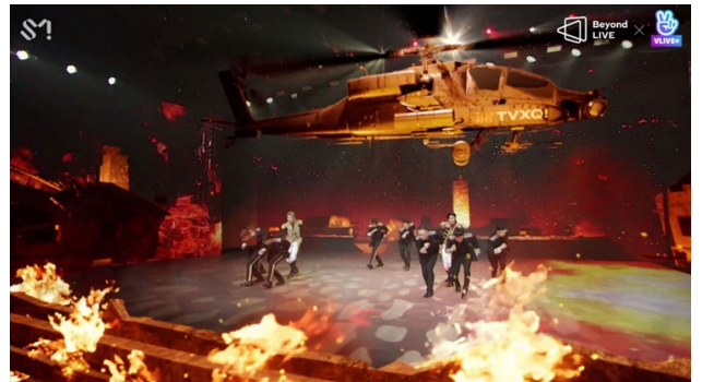
(左)世界のファンとリアルタイムでコミュニケーション (右)最新技術を駆使したオンラインならではの演出

当該事業を承継したSMEJは、新規事業として株式会社Beyond Live Corporation（以下、「BLC」といいます。）を子会社として設立し、オンライン専用コンサート『Beyond LIVE（ビヨンドライブ）』の運営を開始いたしました。