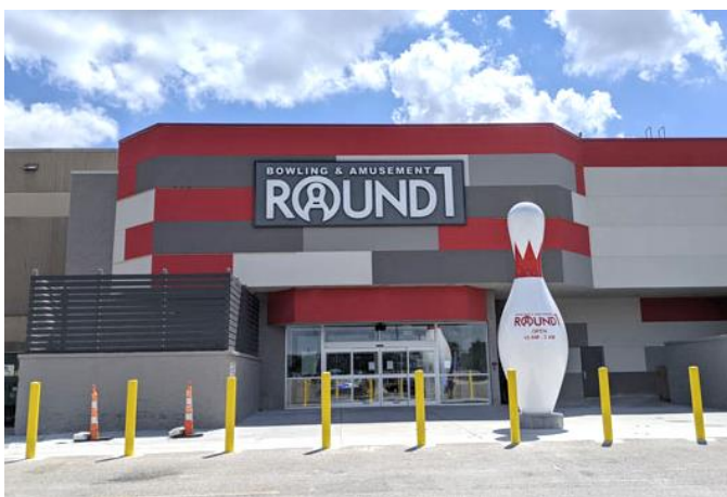
ラウンドワン タウンイーストスクエア店 米国 カンザス州ウィチタ 2020年7月18日オープン！