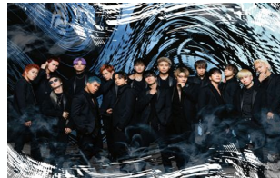
THE RAMPAGE from EXILE TRIBE