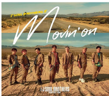
三代目 J SOUL BROTHERS from EXILE TRIBE