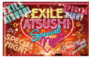
EXILE ATSUSHI/ RED DIAMOND DOGS