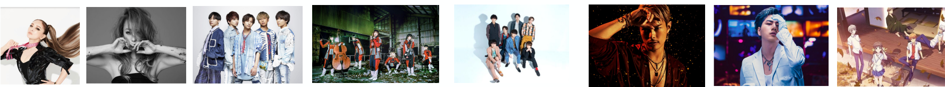
浜崎あゆみ 倅田來未 Da-iCE BiSH Kis-My-Ft2 RYUJI IMAICHI / HIROOMI TOSAKA フルーツバスケット