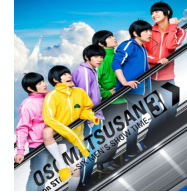
舞台 おそ松さん on STAGE ～SIX MEN'S SHOW TIME3～