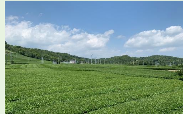
静岡県袋井地区にある約40haの茶園