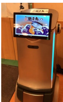
α1型(左:標準 右:デザインカッティング可能)

配膳AIロボット3機種のラインナップ化へ（標準タイプ月額レンタル代 6万5千円～10万円）