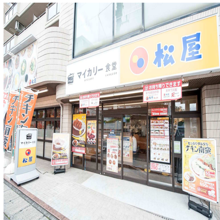
松屋 梶が谷店(マイカリー食堂との複合店舗)

2021年3月期 計画85店舗 (前期155店舗) うち、全面改装4店舗、 一部改装73店舗、複合/DT改装8店舗 (前期 全面:9店舗 一部:146店舗)