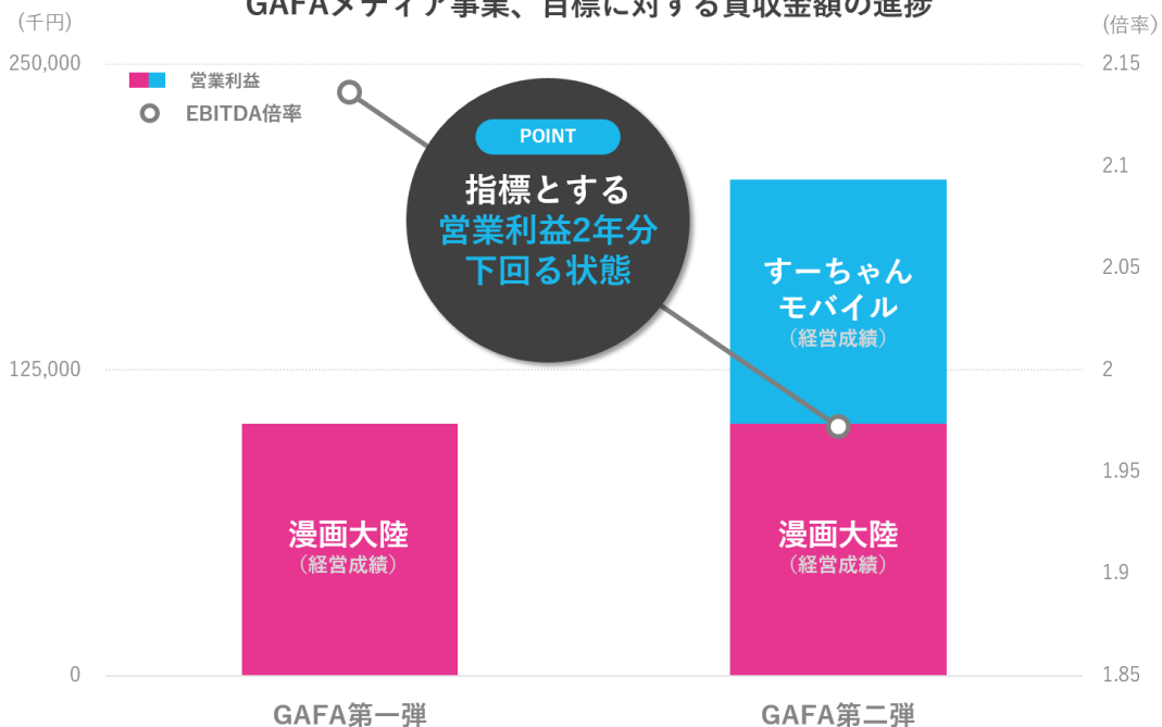
GAFAメディア事業、目標に対する買収金額の進捗

今後は、保有メディア数の拡大、メディア PV 数の拡大、メディア収益性の維持・向上を軸とし「メディア PV 数」×「利益率」の最大化により、投資金額の早期回収を目指してまいります。