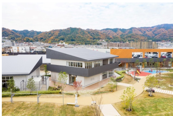
コミュニティパーク大津京