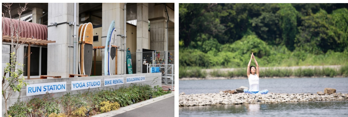
BLUE 多摩川アウトドアフィットネスクラブ