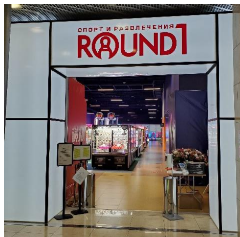
ラウンドワン ユーロペイスキー店 ロシア モスクワ市キエフスカヤ 2020年12月14日オープン！