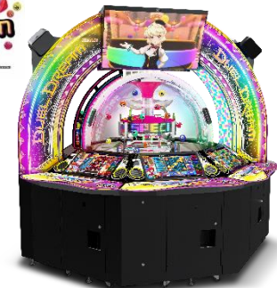
『DUEL DREAM』 @Konami Amusement