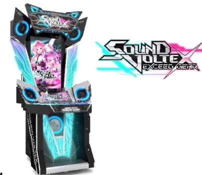
『SOUND VOLTEX -Valkyrie model-』 @Konami Amusement