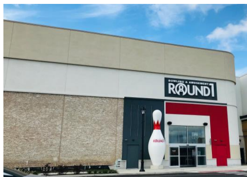
ラウンドワン デプトフォード店 米国 ニュージャージー州デプトフォード 2020年10月24日オープン！