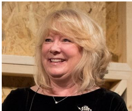
コーアン スカジニア Sustainable Brands