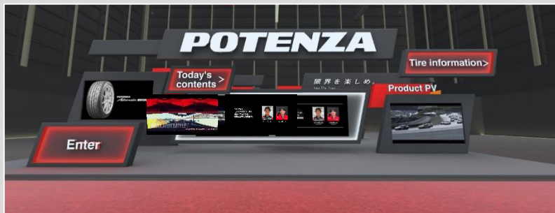
バーチャルブース