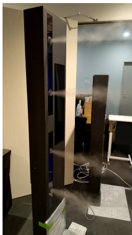
<除菌薬剤噴霧の様子>

また、噴霧する除菌液に関しましては広く市場に出ております、口に入っても安全な除菌液を想定しておりますが、当社の推奨剤としては、経済産業省認定成分である「第4級アンモニウム塩含有製剤」と「2-フェノキシエタノール」を主成分で、非アルコール、非塩素で高い除菌効果と人体への安全性を 24 年にわたり実証している、食塩水よりも安全なエビデンスのある「ウィルスフリーX」と、させていただきます。