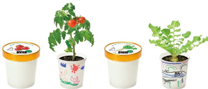
GreenSnap 社オフィシャルプロダクト “すくすく栽培セット”

上記共同企画に関する第一弾の取り組みとして、「3. 実施店舗及び期間について」に記載の店舗へご来店いただく親子に対して、GreenSnap 社オフィシャルプロダクト“すくすく栽培セット”を限定配布します。その後も、当社店舗において、GreenSnap 社の運営アプリ「GreenSnap」にて人気の植物や花の販売及び展示、親子で楽しめるワークショップ、親子で育てた野菜を店舗で調理して食べる企画など、段階的に展開を行い、より多くのご来店者へ親子で植物を育てる体験を推進してまいります。