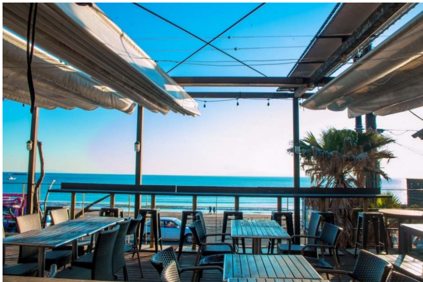
当社店舗（海沿いのキコリ食堂）