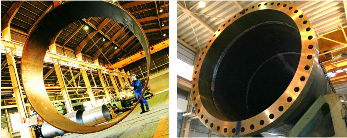
大型配管のイメージ