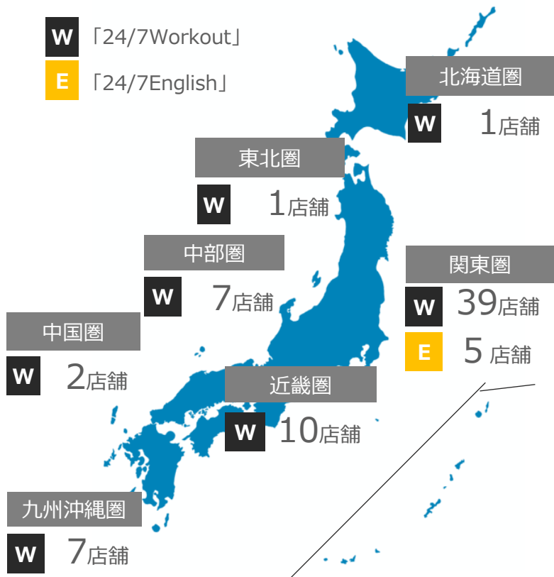
現在の地域別国内店舗網