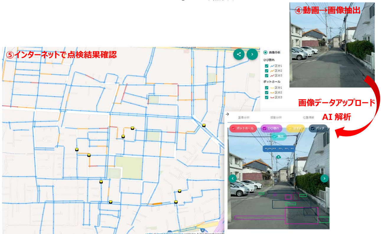
「GLOCAL-EYEZ」の点検結果確認画面例