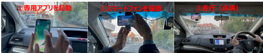
「GLOCAL-EYEZ」による点検イメージ

「GLOCAL-EYEZ」は、点検の専用車や専用のビデオカメラ等を使わずに、誰もが持っているスマートフォンで舗装道路を撮影するだけで、舗装路面のひび割れの損傷状態などを安価に点検することができます。専用アプリを用いて撮影した動画からアプリ内で画像抽出し、それをそのままクラウド上の AI 解析サーバに手軽にアップロードできます。アップロード後、即座に AI で自動解析され、いち早くインターネット上で点検結果を確認することができます。解析項目は、ひび割れの他に、安全運転に支障をきたす穴ぼこ、道路利用者や住民からの苦情のもととなる段差、センターライン等の路面標示のかすれなどです。