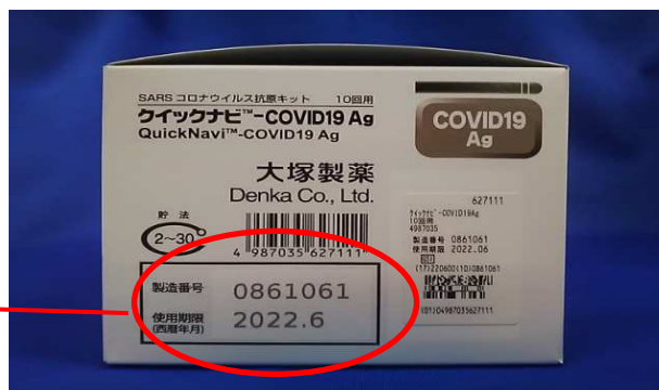
箱の側面に記載されています。