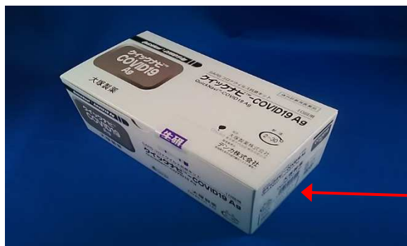
[大塚製薬販売品] 外箱写真