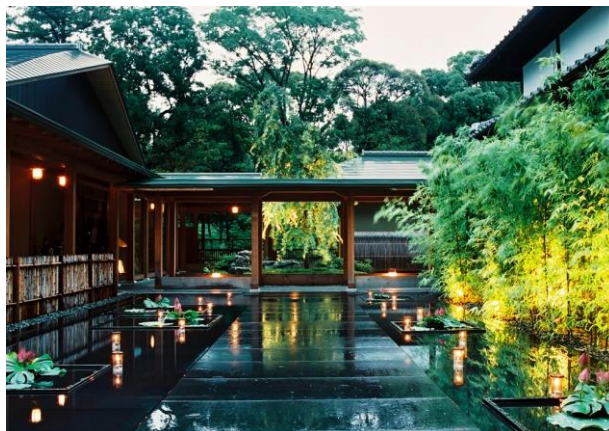
ガーデンレストラン徳川園