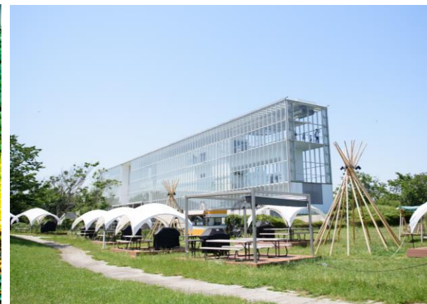
葛西臨海公園 ソラミドBBQ