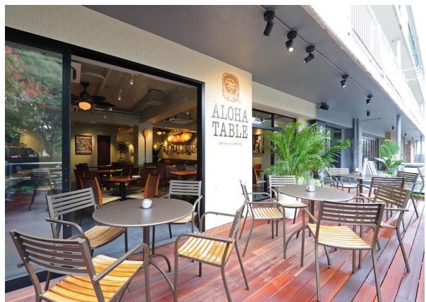
アロハテーブル代官山店

*公募設置管理制度:公園のパブリックスペースを運営する民間事業者を公募により選定する制度