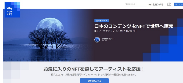
Why How NFT サイト