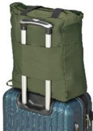
スマートに荷物を運べる キャリーオン仕様