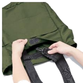
ポケットにリュックベルト が収納できる