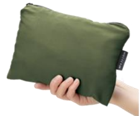
ポケットに収納できる ポケットブル仕様