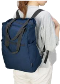
リュックとしても使える 2wayバッグ