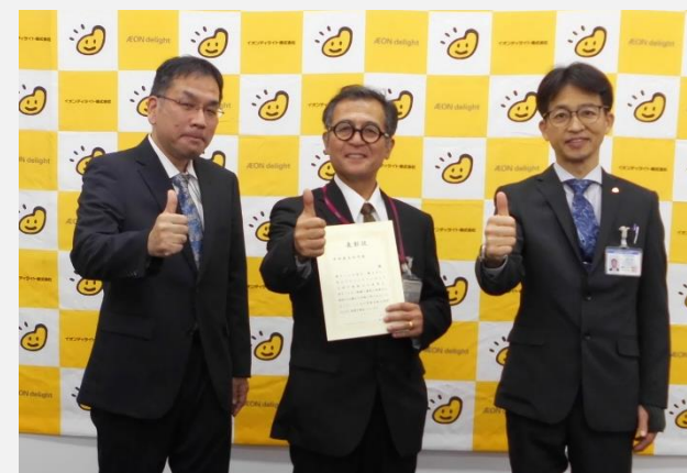
(写真左から) 「設備事業の部」 「清掃事業の部」 「警備事業の部」

国内外グループ各社やパートナー企業各社（清掃・警備）のメンバーらが互いの技術や取り組み成果、好事例を競技、披露しました。