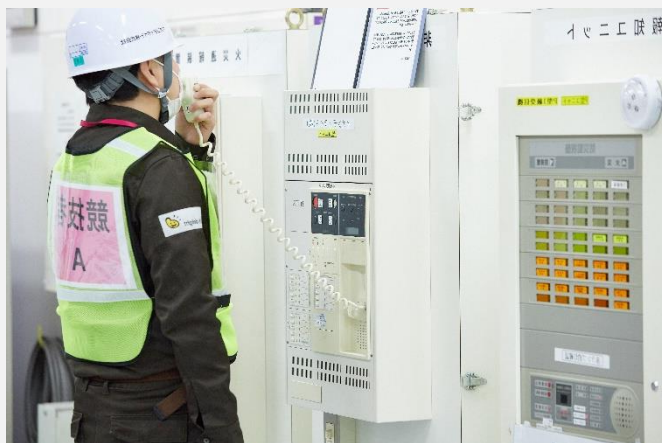
【各コンテストの様相】