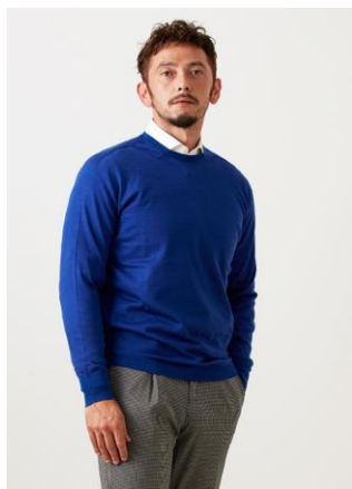
【メンズオーダーニット】

新たなオーダーアイテムとして、「オーダーニット（メンズ・レディス）」、「レディスオーダーコート」を商品ラインナップに追加。さらに、3月～キッズ・ジュニアオーダーをスタート。