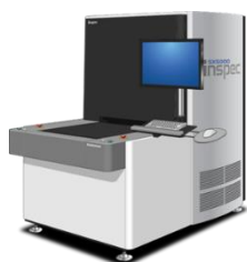
フラットベッド型検査装置

当社は、顧客の新しいニーズに積極的に対応していくことに加え、高い評価を頂いているきめ細かいサービスを充実させ、さらなる受注獲得に向けて全社一丸となって取り組んでまいります。