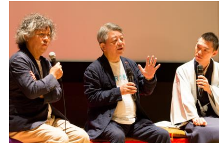
Vol.18&19 茂木健一郎さん・柳家花緑さん 22