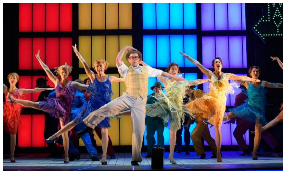
【ミュージカル】SINGIN' IN THE RAIN ~雨に唄えば~