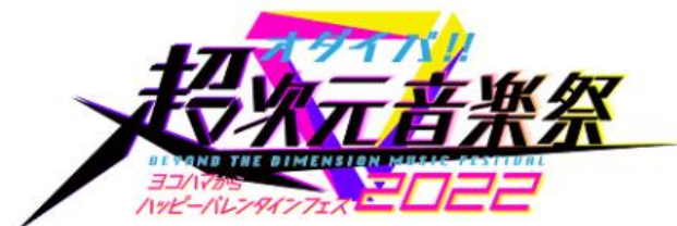
【音楽】オダイバ!!超次元音楽祭 ヨコハマからハッピー バレンタインフェス2022