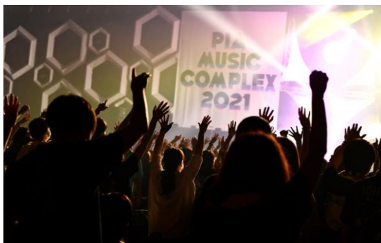
【音楽】PIA MUSIC COMPLEX —ぴあフェス—