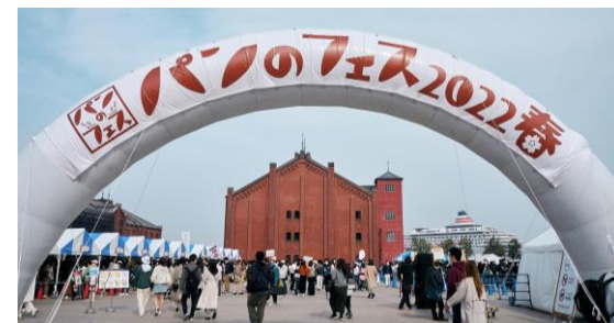
【イベント】 パンのフェス2022春