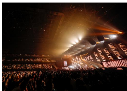
【音楽】MTV LIVE MATCH