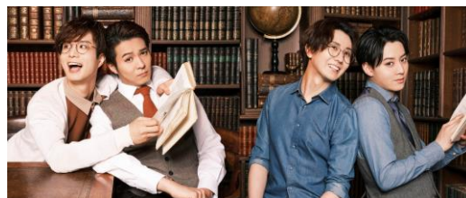
【ミュージカル】 ストーリー・オブ・マイ・ライフ