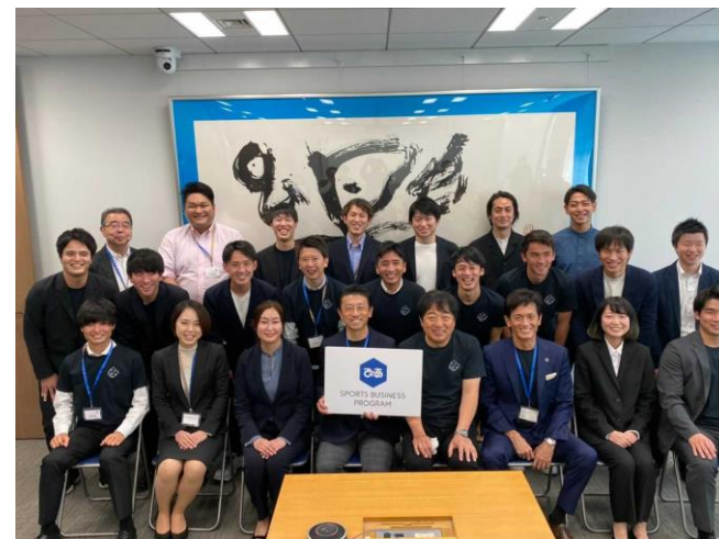
「ぴあスポーツビジネスプログラム」第1期修了式。 第2期も、2022年4月にスタート

日本のプロスポーツ産業に必要な人材を育成する「ぴあスポーツビジネスプログラム」(SBP/2021年4月開講)の第1期22名が修了、卒業生よりスポーツ業界に人材を輩出。