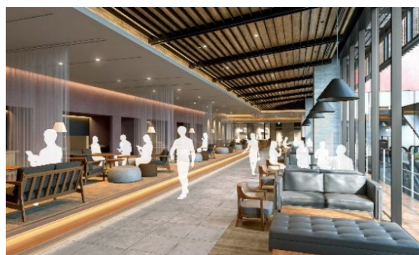
＜ラウンジイメージパース＞