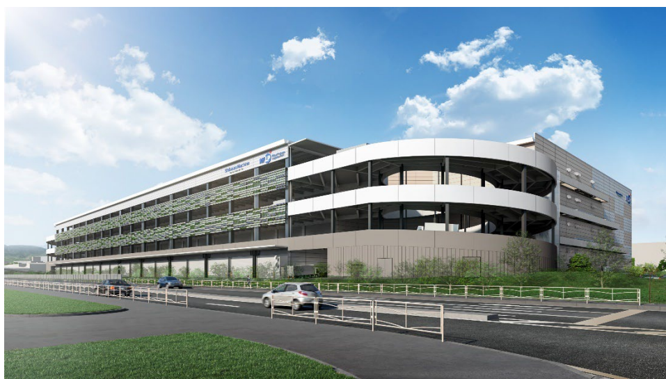
「MFLP 座間」完成予想イメージ

「MFLP 座間」は、東京都と神奈川県・静岡県東部を結ぶ大動脈である国道 246 号線に面する約 62,810 m 2 の敷地に、ダブルランプウェイ、免震構造、全館空調を備える地上4階建て、合計延床面積約 134,500 m 2 のマルチテナント型の物流施設となる予定です。