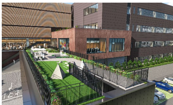
＜デッキテラスイメージパース＞