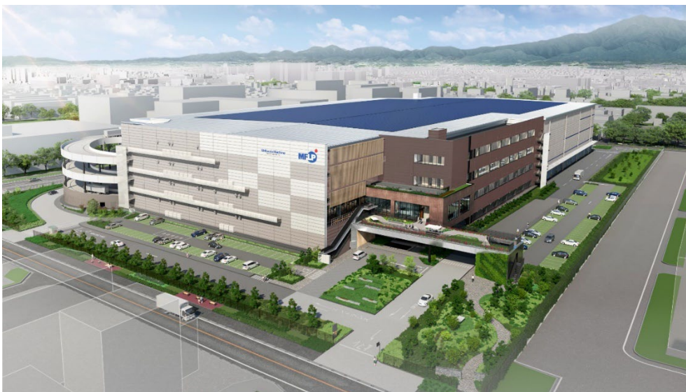
<外観イメージパース>

『ZEB』認証を取得し、太陽光発電とトラッキング付非化石証書の活用により再生可能エネルギーを 100%供給可能とすることで、利用実態に合わせた施設全体の CO2 排出量実質ゼロを目指した環境配慮型施設(商標登録済み)