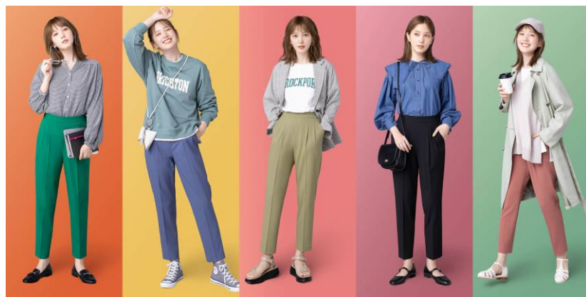
豊富なサイズ・カラー展開が好評