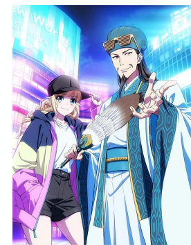
©四葉タト・小川亮・講談社 / 「パリピ孔明」製作委員会 「パリピ孔明 Blu-ray 第一計」