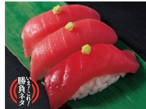
近代生まれマグロ 3貫