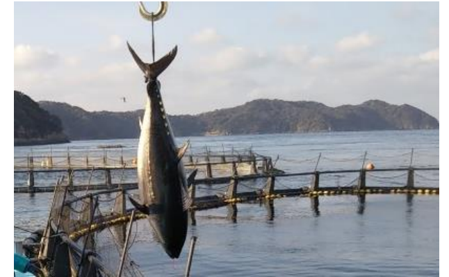
水揚げされている様子