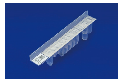
MadDEA Dx SV