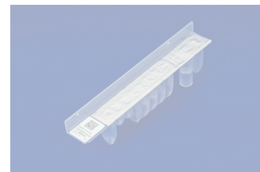
MadDEA Dx SV