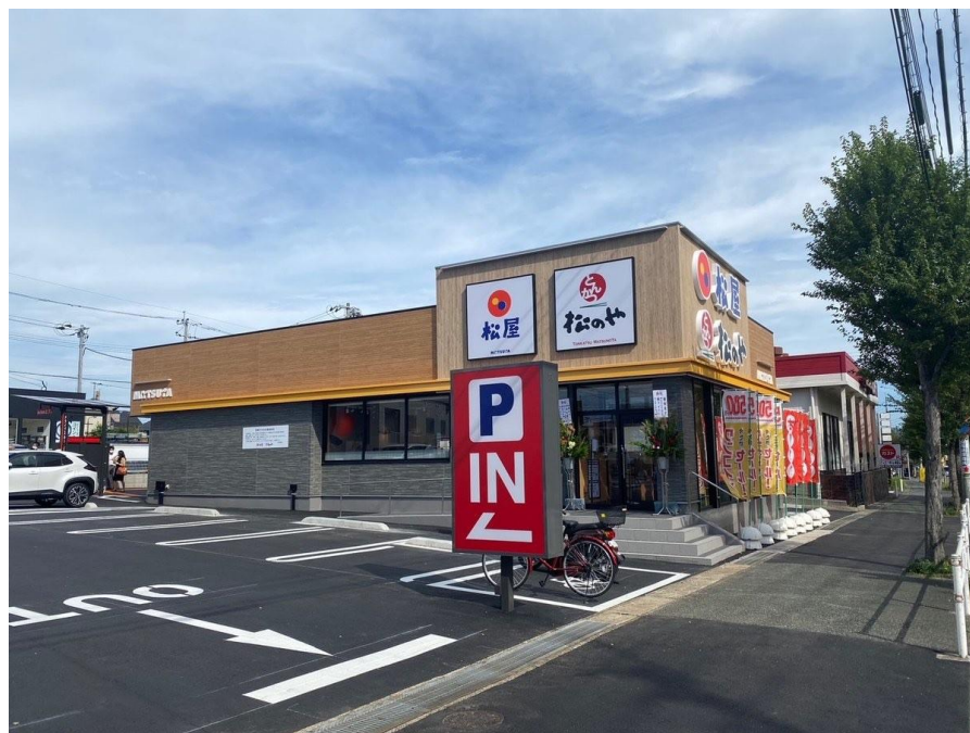
松屋 北九州高須東店 (松屋+松のやの複合店舗) 2023年9月7日OPEN

うち、全面改装1店舗、 一部改装店舗161店舗 * 他、リフレッシュ改装73店舗