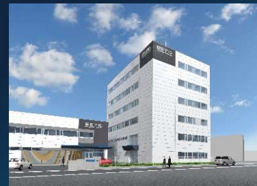
本社 ・ 東郷事業所