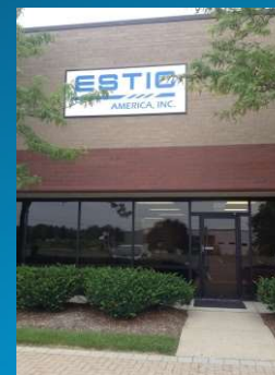
ESTIC AMERIC Inc