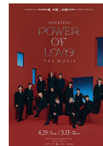
©2022 HYBE ALL RIGHTS RESERVED. MADE IN KOREA 「SEVENTEEN POWER OF LOVE : THE MOVIE」