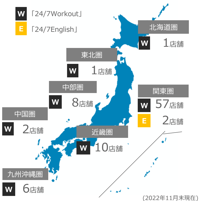
現在の地域別国内店舗網