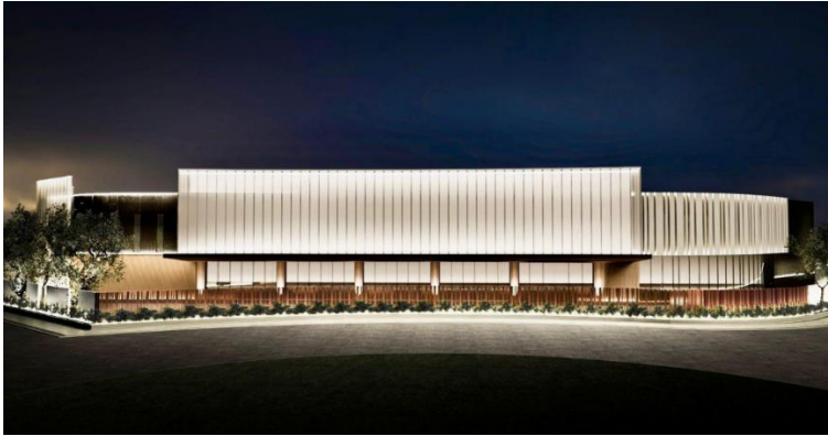
正面からのアングル