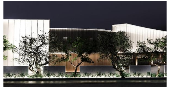
横からのアングル