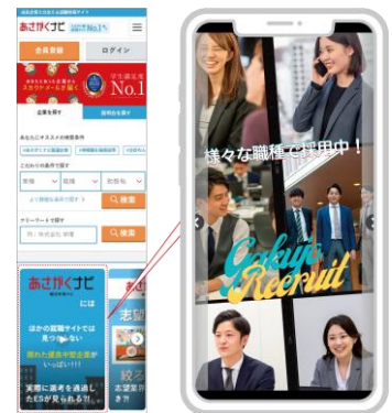
※ Re就活・あさがくナビに搭載 SNSテストの縦型動画