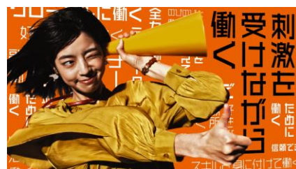
※ Re就活テレビCM (全国でオンエア)