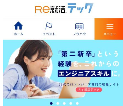
※ Re就活テックサイトイメージ