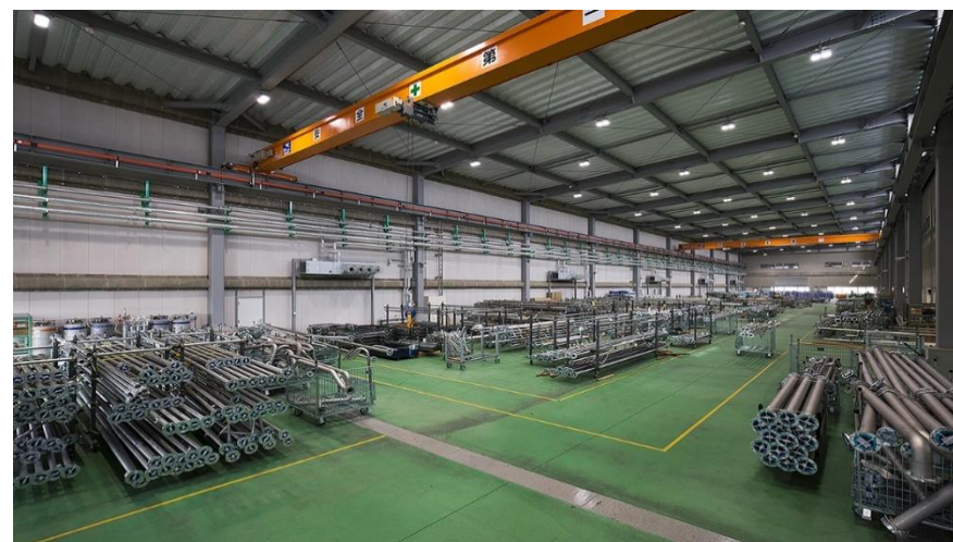
(設備加工工場のイメージ 写真は朝倉工場)