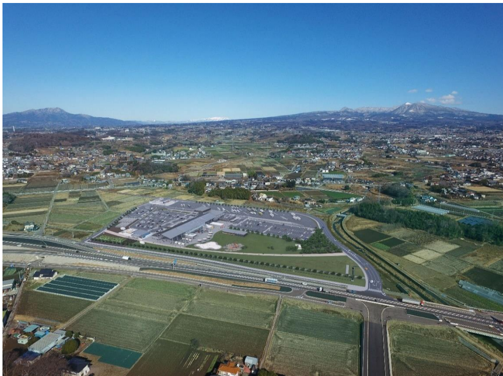
(道の駅まえばし赤城 施設全体の完成イメージ)

「ここにしかないこだわりの農業」「ここでしか出会えない食」「ここにしかない時間」