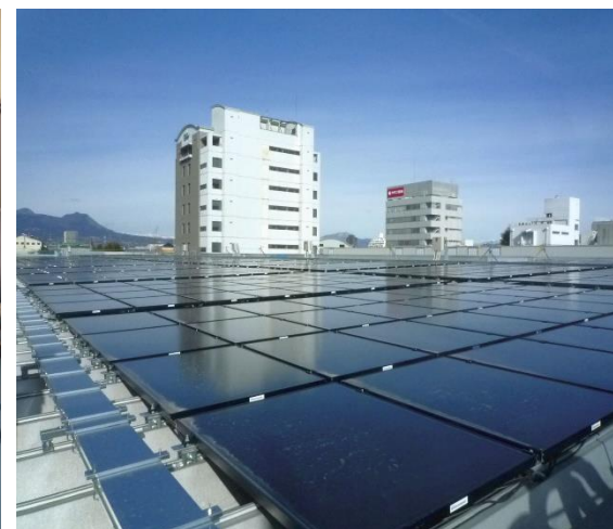
(ヤマト第二別館 太陽光パネル)