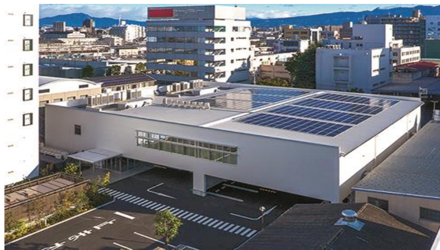
(ヤマトプロダクトセンター外観)