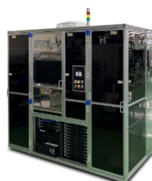
ロール to ロール型検査装置