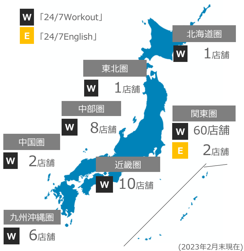
現在の地域別国内店舗網