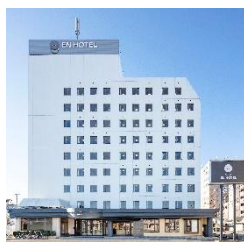
EN HOTEL Ise (本投資法人保有物件)