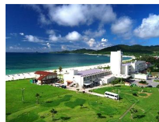
久米島 イーフビーチホテル