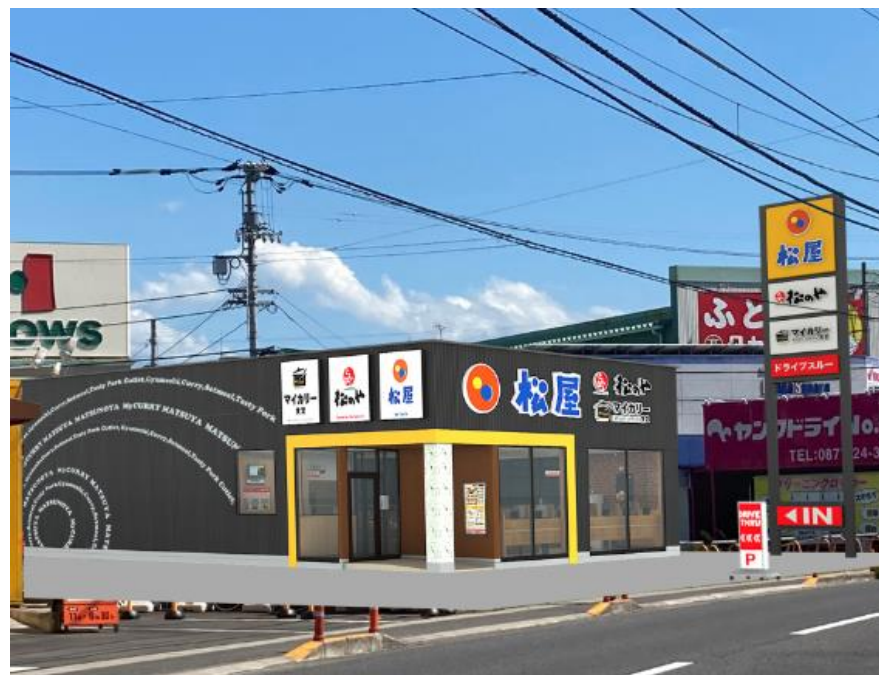
R丸亀中府店 (松屋+松のや+マイカー食堂の複合店舗) 2023年3月15日OPEN