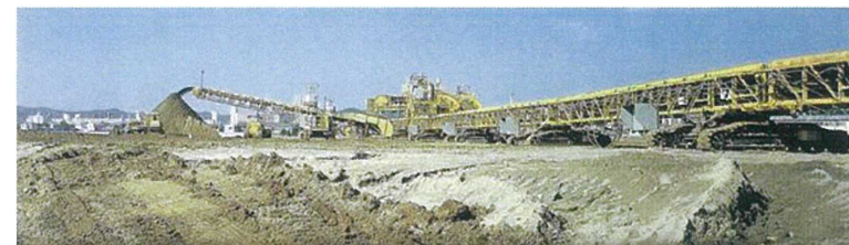
東亜建設(株)様（海の公園 埋立工事）