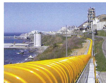
日鉄鉱業(株)様（尻屋鉱業所）