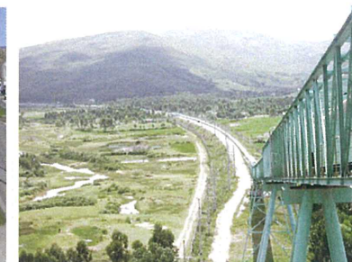
ギソンセメント様(ベトナム)