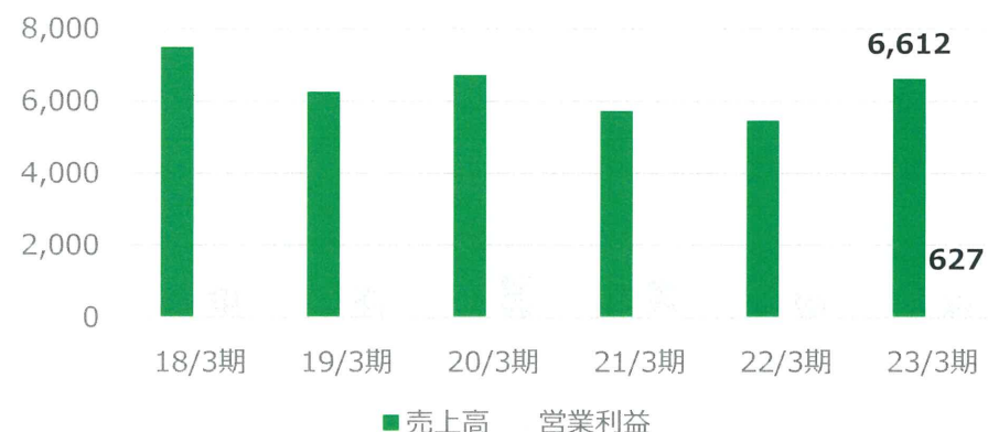
立体駐車装置関連 (単位：百万円)