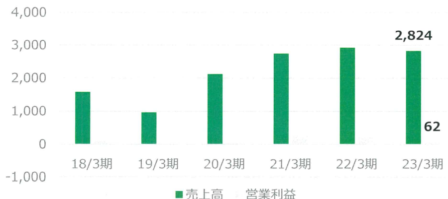
再生エネルギー関連 (単位：百万円)