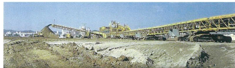
東亜建設(株)様（海の公園 埋立工事）