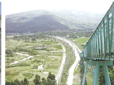
ギソンセメント様(ベトナム)