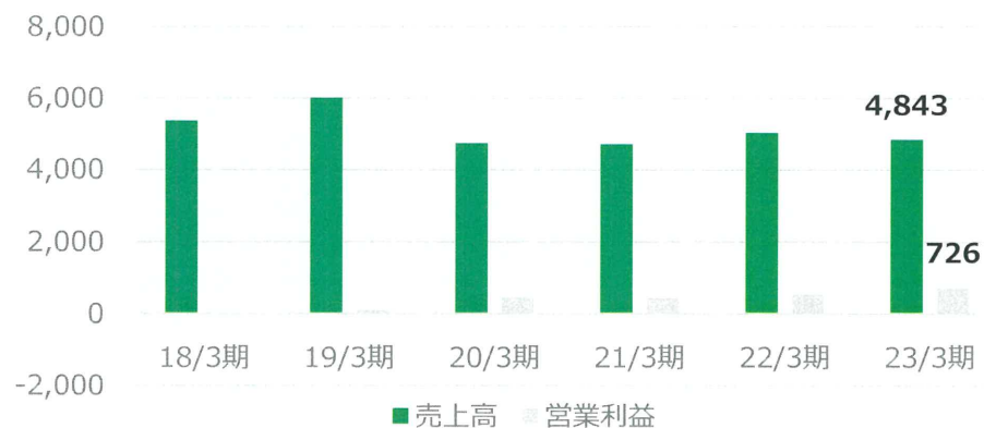
コンベヤ関連 (単位：百万円)