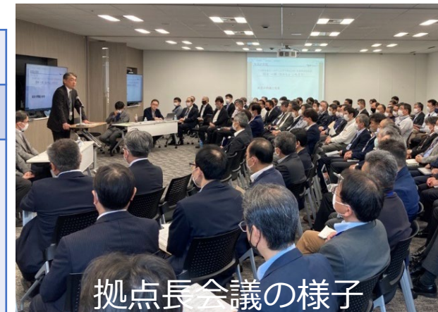
拠点長会議の様子

※工場長、支店長、営業所長のほか、従業員20名以上の拠点については20名ごとに1名の代表者