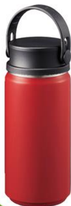
ハンドル付 サーモボトル