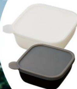
書き込める フードコンテナ 280mlと400ml