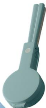
カトラリーセット