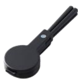
チャコールブラック